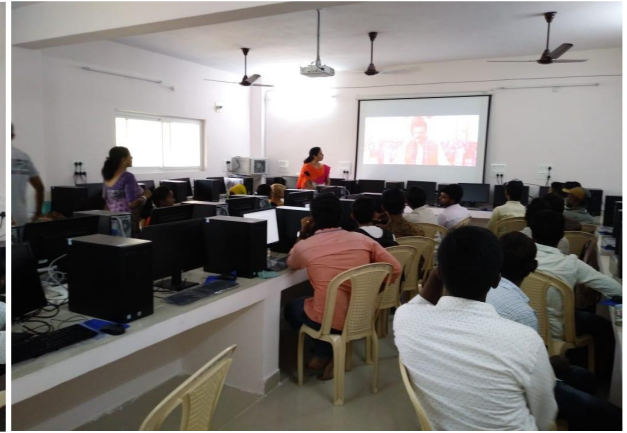
Pre - Assessment Test by HireMee Services on 21.02.2019