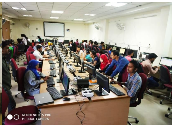
Career Awareness Program by ICICI Disha Trust on 26.02. 2019